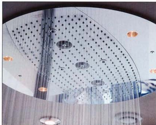
La douche de la 1014. Située au centre de la chambre et surdimensionnée, elle est équipée d'un système « rain shower » : un brumisateur simule toutes les intensités de la pluie, de la mousson au fin crachin. L'utilisateur a le choix entre plusieurs ambiances lumineuses.