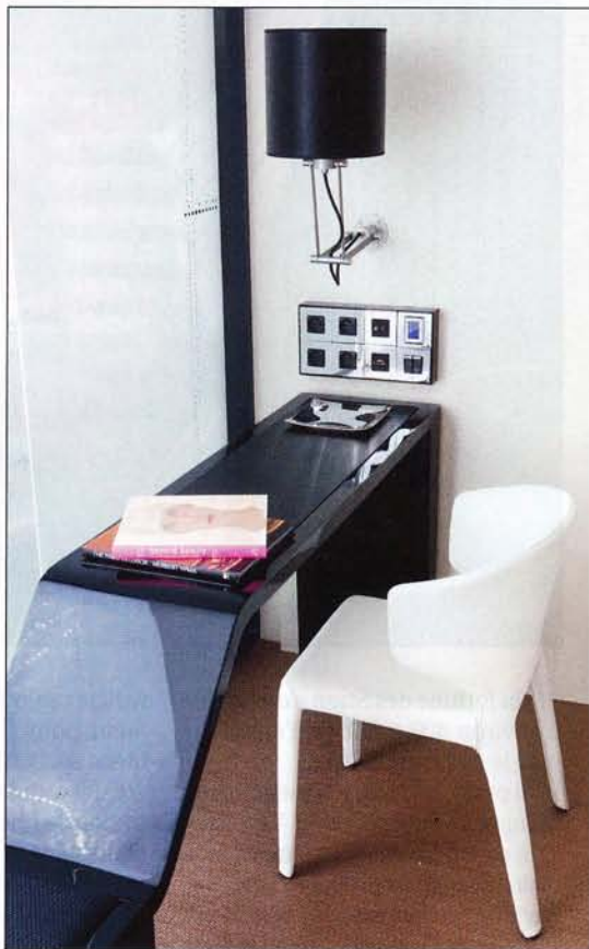
Le bureau de la 1014. Une grande console dans l'esprit Le Corbusier permet de s'asseoir, de se vautrer ou de travailler, avec toutes les connexions nécessaires : prise iPod/MP3, Internet ou partage d'écran PC-vidéoprojecteur.