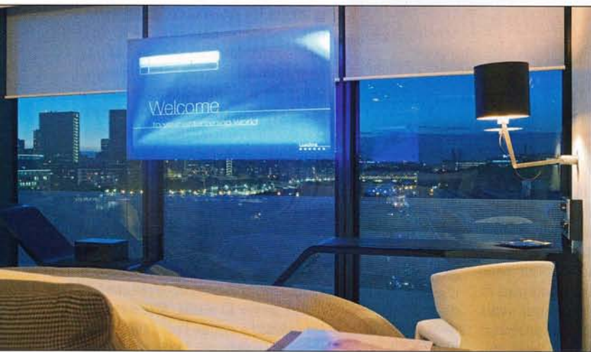
L'écran de verre de la 1014. C'est une expérience inédite : regarder la télévision, son iPod ou son ordinateur avec Paris et la Seine en toile de fond. L'image, d'une très grande netteté, apparaît suspendue dans le vide. Autre gadget bluffant : le son, aux basses puissantes, dont la source demeure invisible.